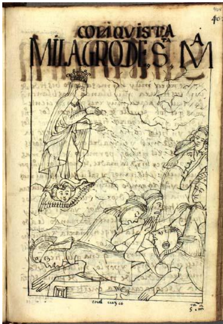
Le miracle de Santa María de Peña de Francia Guaman Poma, Nueva corónica y buen gobierno (1615). Bibliothèque Royale de Copenhague

Cette justification de la victoire et, au-delà, la légitimation de la conquête, par le recours à l'imaginaire, est présente plus encore dans le récit de la rencontre de Cajamarca. En effet, au cours de celle-ci, le Père Valverde énumère les principales divinités catholiques mais aussi le pouvoir temporel de l'époque dans la vision synthétique de sa foi qu'il propose à l'Inca.